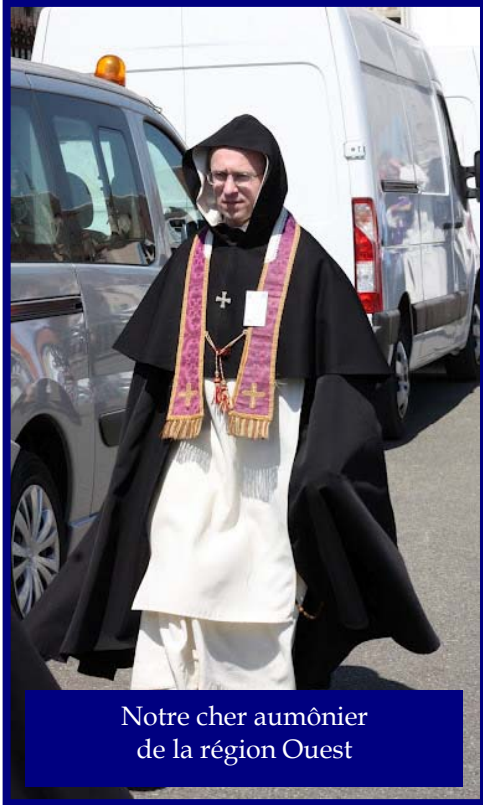
Notre cher aumônier de la région Ouest

C'est merveilleux de voir de jeunes célibataires, des pères et des mères de famille se donner chaque année pour ranimer l'ardeur des pèlerins insouciant, préparer les médit' (même si c'est plus facile maintenant), renoncer à un superbe week-end de mai « copains, rosé frais, grillades, piscine » et partir à pieds 3 jours, vivre dans un confort très précaire, secouer au point du jour, dans des tentes trempées, des sacs de pèlerins hébétés et crasseux, marcher et marcher encore. Et vous les retrouvez, à Chartres, éblouis, rayonnants, promettant d'être là l'an prochain.