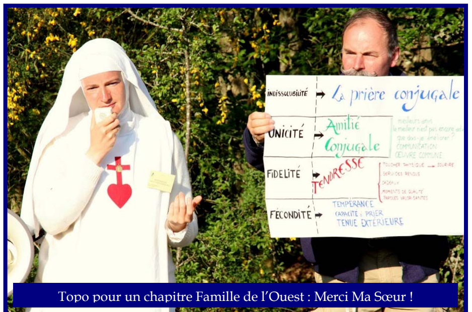
Topo pour un chapitre Famille de l'Ouest : Merci Ma Sœur !

Redevenir simple pèlerin ! Marcher avec le Bon Dieu sans avoir à se préoccuper du compte-rendu !