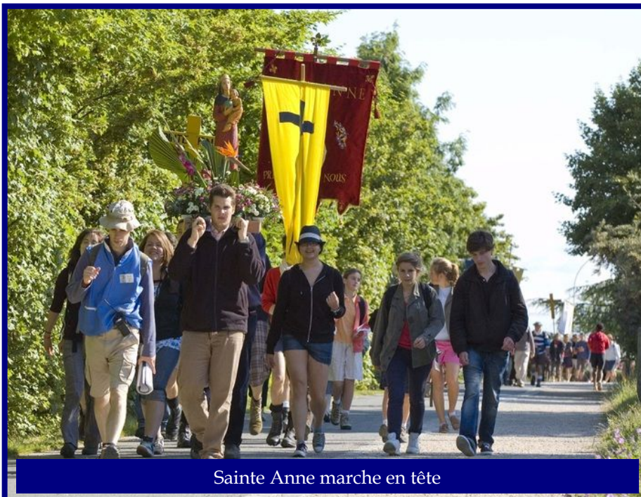
Sainte Anne marche en tête

Saint Pierre-es-Liens et du village autour). Ces chapitres recrutent auprès des bénévoles qui travaillent, toute l'année, sur le chantier.