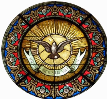
Sainte Foy-Penitentsblancs — CC BY-SA 3.0

Demandons la grâce à la Vierge Marie de recevoir l'Esprit Saint pour la mission, pour annoncer le Christ autour de nous, au travail, en famille, dans nos activités.