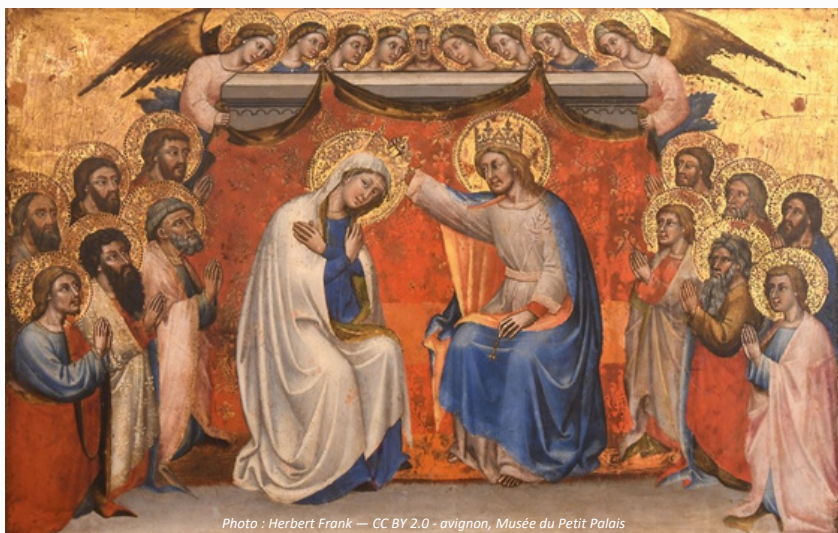
Photo : Herbert Frank — CC BY 2.0 - avignon, Musée du Petit Palais

Prions l'Esprit Saint de nous faire vivre de cette espérance durant notre vie afin de mieux nous préparer à notre mort.