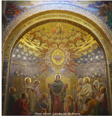
Lourdes-ND-du-Rosaire