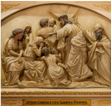
JÉSUS CONSOLE LES SAINTES FEMMES

La tradition du chemin de croix vient comme pour compenser ou plutôt développer la brièveté de la description en une phrase dans les Evangiles. Nous pouvons contempler en cette dizaine la figure de sainte Véronique qui s'élance devant son Maître et Seigneur pour lui laver le visage maculé de crachats, de sang et de sueur. Elle se donne totalement, sans crainte du qu'en dira-t-on, des menaces de la foule, de la dureté des Romains. Son amour gratuit et sans peur l'identifie au Christ et lui donne son nom : "Vraie Icône" , "Véronique" . Puisseons-nous devenir de vraies icônes du Christ miséricordieux, à l'image du bienheureux Isidore qui donna sa vie jusqu'au sang pour témoigner de sa foi dans le catéchisme et la mission.